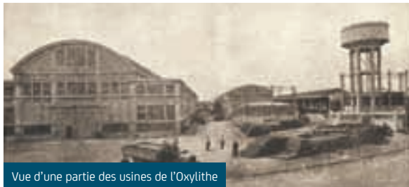
Vue d'une partie des usines de l'Oxylithe

Vous l'avez probablement déjà remarqué, l'ancien site PSA asniérois est en pleine transformation! Fermée en 2010, l'usine PSA est aujourd'hui démolie. Seule la halle centrale a été conservée et va être réhabilitée en un espace de services destinés aux entreprises du futur campus tertiaire.