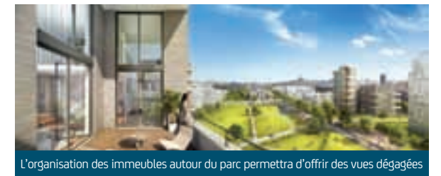
L'organisation des immeubles autour du parc permettra d'offrir des vues dégagées

Accessible à tous, le parc paysager de 1,5 hectare imaginé par l'atelier Arpentère favorisera la biodiversité et donnera ainsi une place importante à la nature.