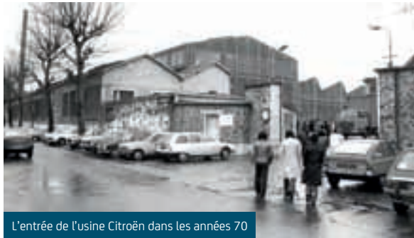
L'entrée de l'usine Citroën dans les années 70

Dans le prolongement de la Zac des Bords de Seine achevée et de la Zac du Parc d'affaires, cette opération va contribuer au renouveau considérable d'un ancien secteur industriel.