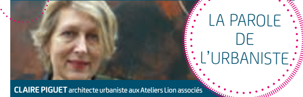
CLAIRE PIGUET architecte urbaniste aux Ateliers Lion associés

Des aires de jeux pour petits et grands, un atelier botanique, un espace sportif mais aussi des lieux de détente seront aménagés pour satisfaire tous les usages. Des cheminements doux permettront de relier la gare des Grésillons aux berges du fleuve en passant par le parc.