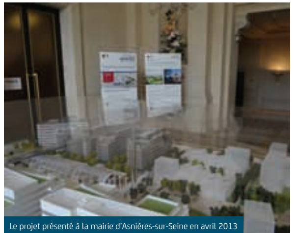
Le projet présenté à la mairie d'Asnières-sur-Seine en avril 2013

Pour vous accompagner tout au long de la réalisation du Quartier de Seine-Est, Nexity a mis en place plusieurs supports de communication.