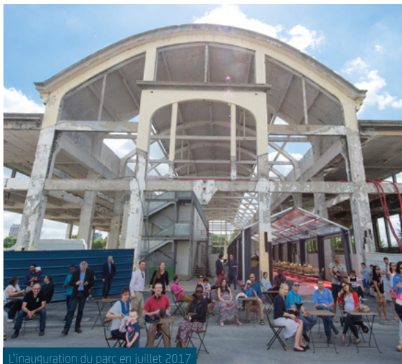
L'inauguration du parc en juillet 2017

La ville organise, le 9 juin prochain, une journée festive dans le Quartier de Seine-Est. Objectifs : accueillir tous les Asniérois, célébrer les réalisations récentes et à venir et faire connaître aux riverains et à l'ensemble des Asniérois, cette entrée de ville complètement transfigurée.