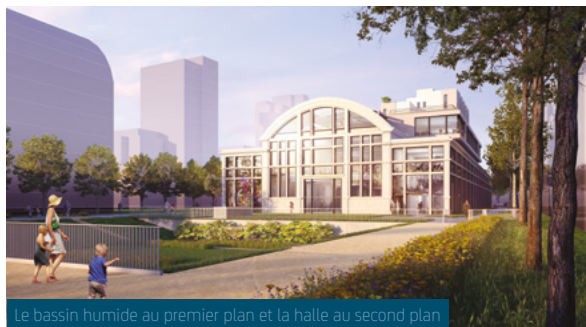
Le bassin humide au premier plan et la halle au second plan

Un bar à la fois ouvert sur le centre sportif et sur une terrasse côté Seine, un hôtel de 130 chambres à destination d'une clientèle familiale & professionnelle, un restaurant ainsi qu'une cellule commerciale contribueront à la seconde vie de la halle. Un parking de 88 places y sera également construit.