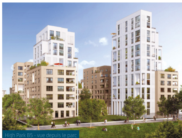
High Park B5 - vue depuis le parc

Deux nouvelles résidences, dont la plupart des logements sont en duplex ou bénéficient de double orientation, vont bientôt sortir de terre. La première, attendue pour mi 2020, se situe à côté de High Park 4. Nommée High Park B5, elle regroupera environ 135 appartements ainsi que deux commerces.