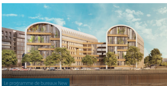
Le programme de bureaux New